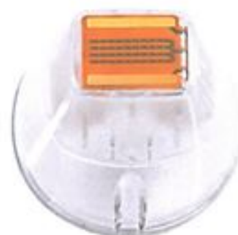
Sublative iD Focal 44 Tip 小治療探頭 (44 pins)