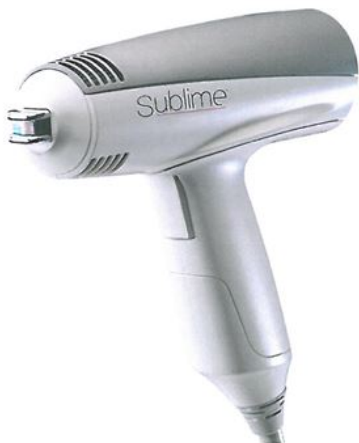
Sublime Applicator Sublime 治療手機