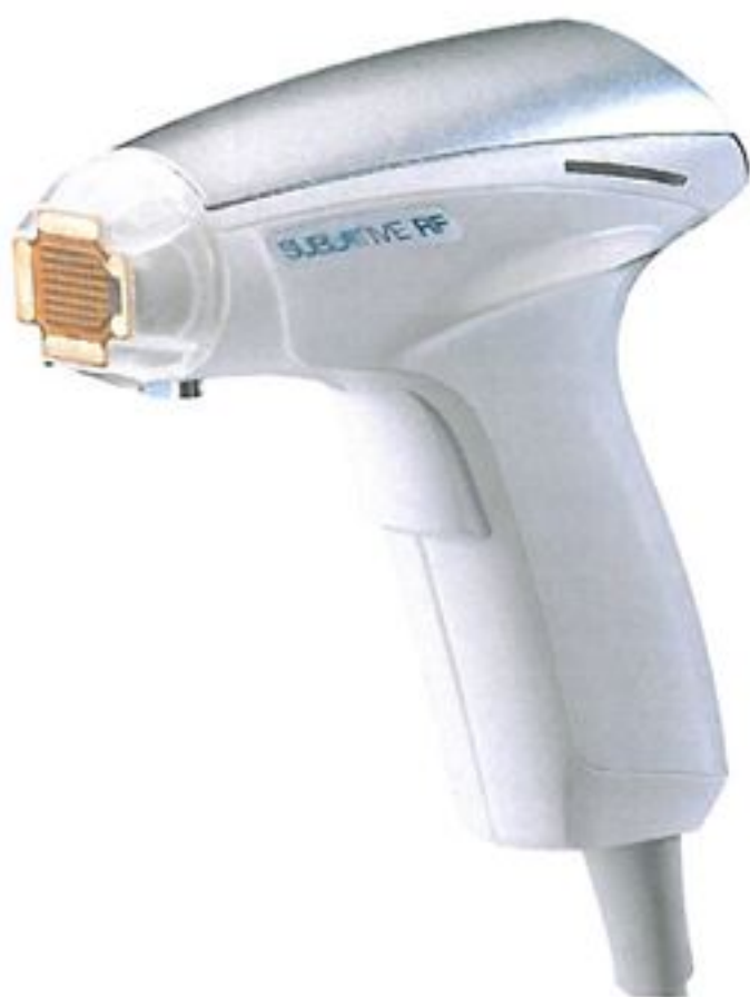
Sublative Applicator Sublative 治療手機